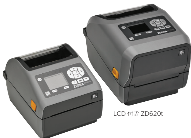
LCD 付き ZD620d

印刷品質、生産性、アプリケーションの柔軟性と操作性を重視するなら、Zebra ZD620 が最適です。Zebra のデスクトッププリンタ製品ラインの次世代製品である ZD620 は、人気の高い Zebra GX シリーズと ZD500 プリンタの後継製品として、従来のデスクトッププリンタとは一線を画した、非常に高い印刷品質と最先端機能を提供します。感熱式と熱転写式の両モデルに加え、医療業界向けモデルで提供される ZD620 プリンタは、さまざまなアプリケーション要件を満たします。Zebra デスクトッププリンタのほとんどの標準機能を搭載し、10 個のボタンとカラー LCD を備えたオプションユーザーインターフェイスを提供する ZD620 プリンタは、プリンタのセットアップとステータスについての憶測による操作を解消します。Link-OS® を搭載し、アプリケーション、ユーティリティ、開発者ツールから成る高性能 Print DNA スイートに対応した ZD620 プリンタは、高性能、容易なリモート管理、統合を実現することで、卓越した印刷体験を提供します。Zebra ZD620 は、業務の進行を継続するために必要なプリンタの速度、品質、管理機能を提供します。